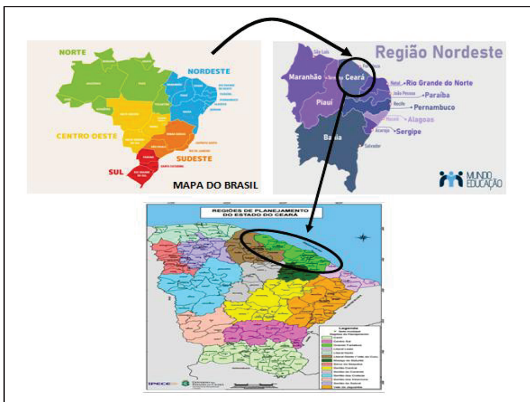
Figura 1 –Localização do estado do Ceará. Região Nordeste. Capital Fortaleza